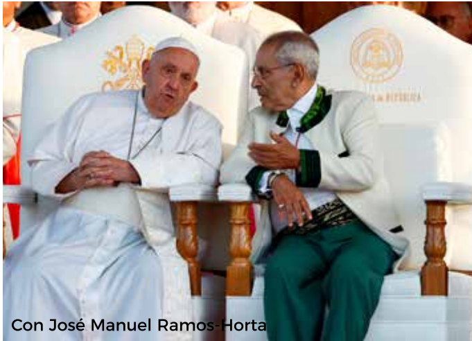
Con José Manuel Ramos-Horta

a fatica la propria indipendenza dall'Indonesia sta lentamente costruendo il proprio futuro. Il 65 per cento della popolazione ha meno di 30 anni, e le strade